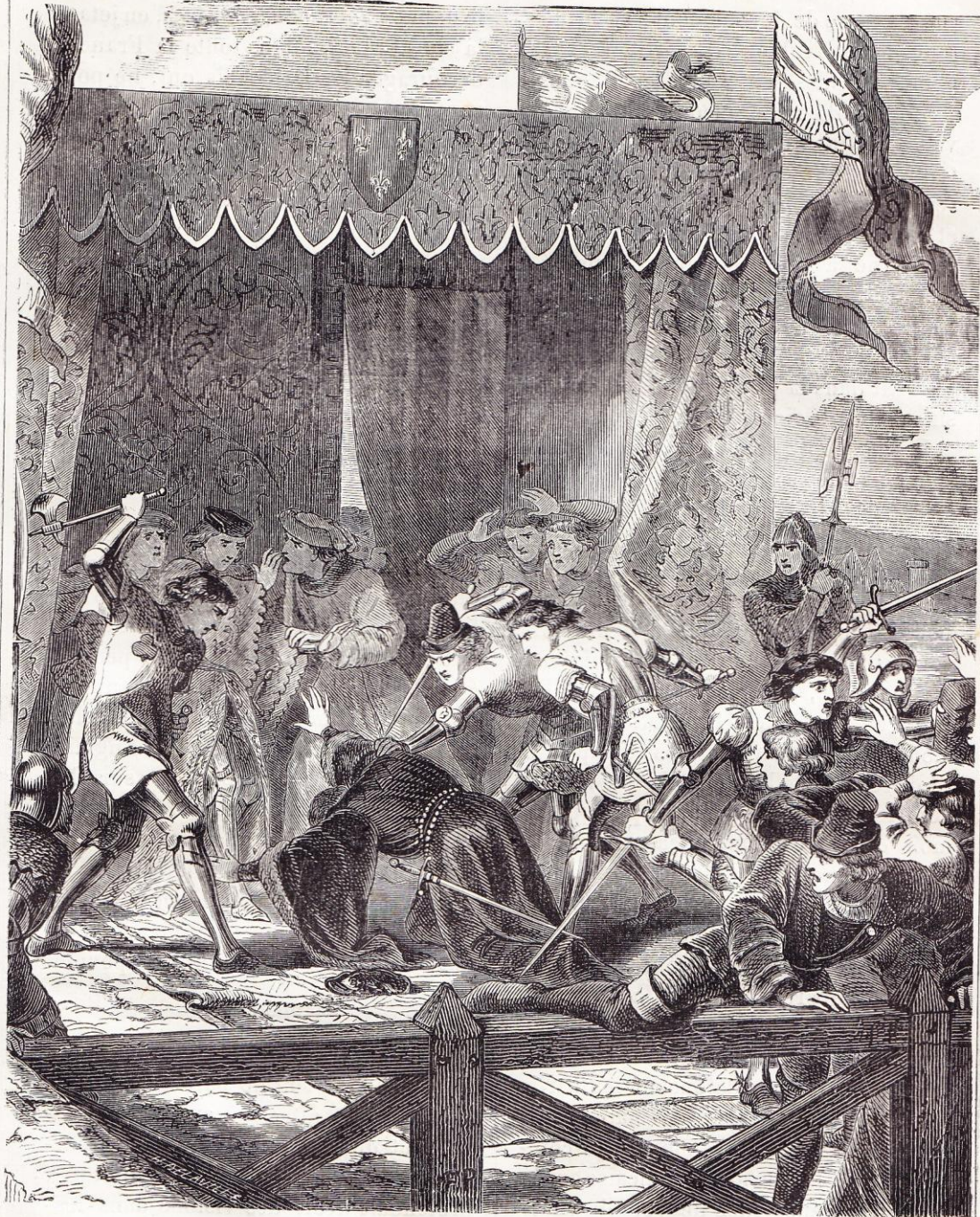
Assassinat de Jean sans Peur au pont de Montereau (10 septembre 1419)

Jargeau, Beaugency, Pithiviers et Chartres, et vint mettre le siège devant