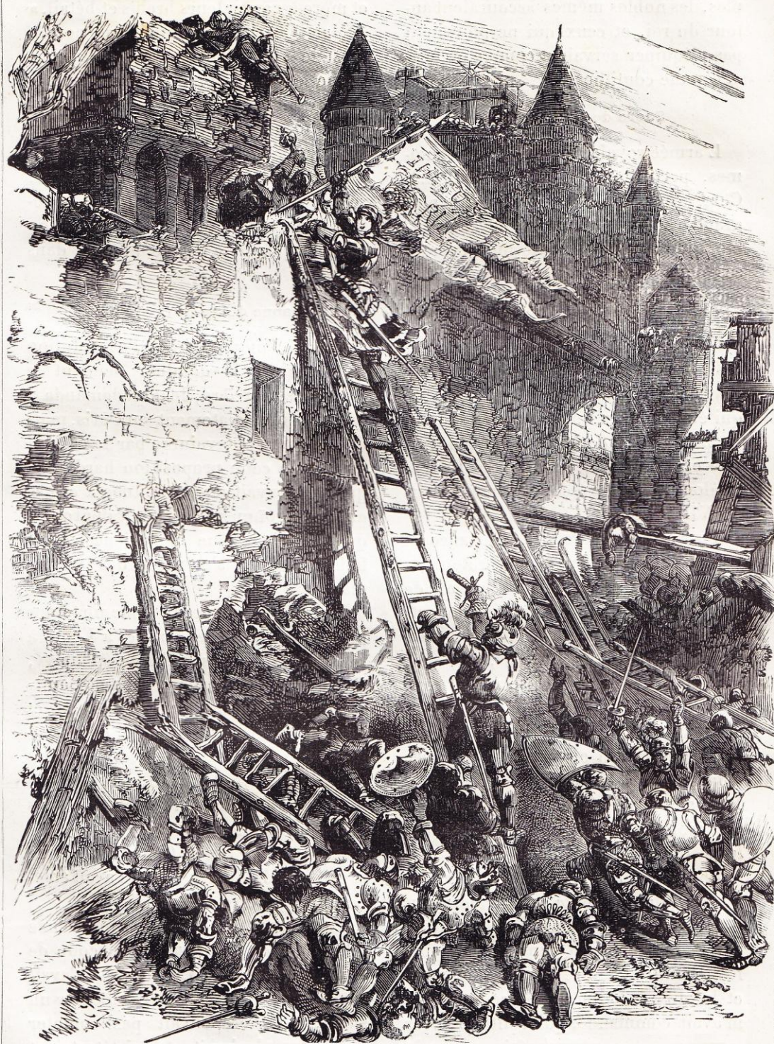
Jeanne d'Arc à l'attaque des Tournelles (1429).